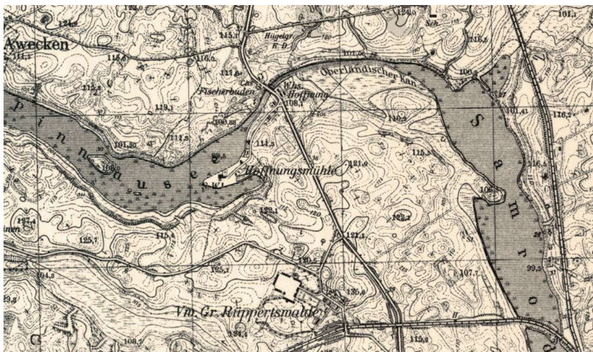
Fot. nr 2. Mapa obrazująca połączenie wybudowanym Kanałem Elbląskim jezior Piniewo i Sambród, stan z początku XX w.